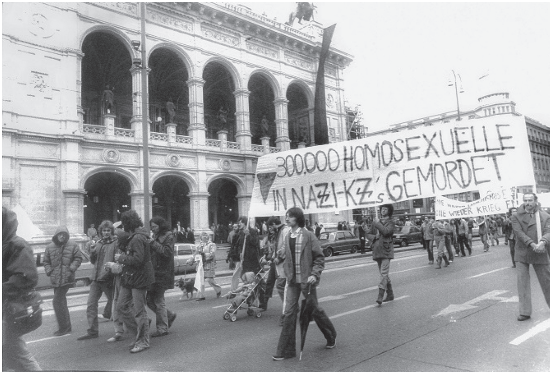
Abb. 1: Demonstration in Wien 1980