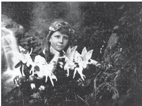
Abb. 2: aus: Arthur Conan Doyle, Alice and the Fairies, in: The Strand Magazine (December 1920), 465.