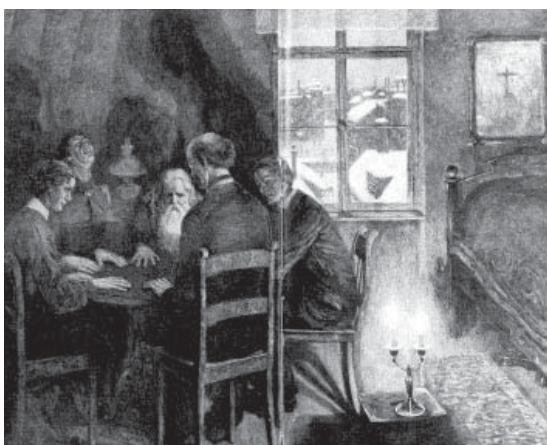
Abb. 3: Hans Baluschek, Die Spiritisten, in: Leipziger Illustrierte Zeitung vom 4. Jänner 1906, Nr. 126, 12 f.